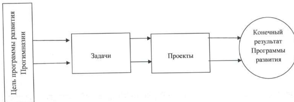
Схема 1. Примерная схема визуализации Программы развития

Разработка содержания каждого проекта предполагает поиск ответов на вопросы, определяющих основные направления работы.